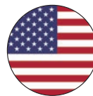
ইউনাইটেড ষ্টেটচ অৱ আমেৰিকা